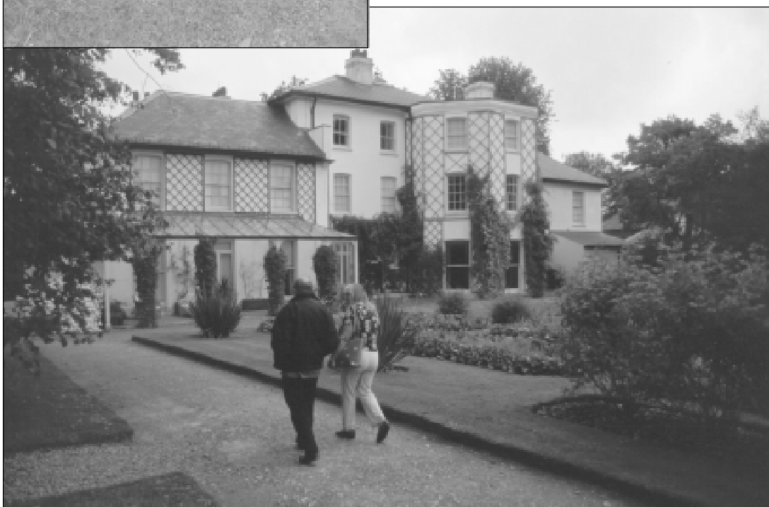
Down House, Darwins hjem