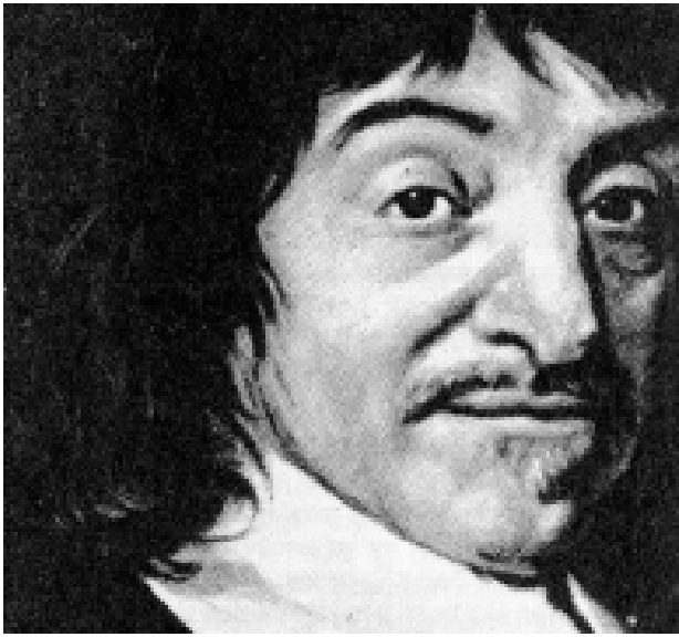
René Descartes (1596-1650)

sekvent. Om man virkelig tror på den antinomistiske myten (myte 5), har man tatt bort grunnlaget for slik moralsk forargelse. Intet absolutt rett eller absolutt galt eksisterer for en ateist, kun maktstrukturer.