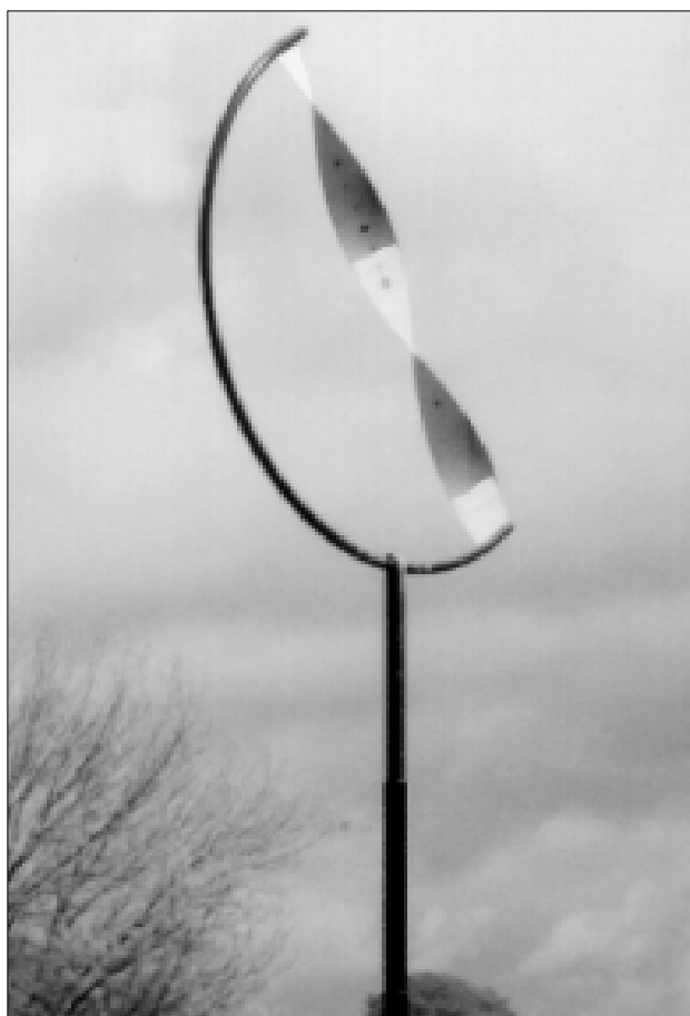
Figur 1. Piet Heins solur ved Egeskov slot. Piet Hein var optaget af selvreferencens problematik, som jo også er væsentlig i forbindelse med det menneskelige sind. Soluret her kan siges at udtrykke selvreferencen, idet den snoede skala kaster skygge på sig selv!

burde være det. Hvor Jesus er i centrum, har man omsorg også for de svageste, bl.a. de nødlidende i andre lande, vore flygtninge og indvandrere, de gamle og ensomme, misbrugerne, de hjemløse, enker og enlige mødre og de ufødte børn. Piet Hein indrømmer, at han har svært ved at omgås sådanne mennesker. Det er ikke underligt, for det kræver en uselvisk kærlighed, som vi ikke kan mande os op til.