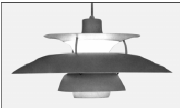
Figur 2: Lampe af Poul Henningsen. Præget af sit humanistisk livssyn mente PH, at det for mennesker praktisk funktionelle er også det smukkeste. Intet i kunsten skal tilsyneladende pege længere end det menneskelige!

P.H. var af livssyn humanist. Humanismen er, i sin rendyrkede form, ikke særlig human, men kristendomsfjendsk og inhuman. Denne form for humanisme kendes bl.a. fra det humanistiske parti, der opstillede til folketinget for ca. 15 år siden. Den kendes dog bedst fra det humanistiske manifest, hvoraf det tydeligt fremgår, at den er baseret på udviklingslæren og det ateistiske livssyn. Egoet er i centrum, og gør-som-du-vil-filosofien fører ofte til en ringe etik og moral: de svage bukker under i den barske kamp for tilværelsen, bl.a. ved fosterdrab, medlidenhedsdrab, dårlig behandling af handicappede, gamle og syge på kolde, umenneskelige institutioner. Poul Henningsen var en hård samfundsrevser. Han ironiserede over statsmagten og samfundslivet bl.a. i sine revyviser. P.H. var det, man kalder kultur-radikal, ofte forbundet med dagbladet "Politiken" - i alt fald i 1930'erne og 1940'erne. De kulturradikale gik typisk ind for ligeløn, kvindefrigørelse - og provokeret abort. Til denne retning hørte også P.H.s mor, Agnes Henningsen.